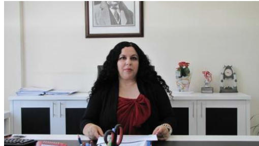
Yüksekokul Sekreter V.