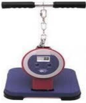
Şekil 2. Sırt-bacak dinamometresi

Ölçümler dinamometre (Şekil 2) kullanılarak yaklaşık beş dakika ısınmanın ardından, denekler dizleri bükülü durumda dinamometre sehpasının üzerine ayaklarını yerleştirdikten sonra kollar gergin veya bükülü (adayın isteğine göre), gövde hafifçe öne eğik, elleriyle kavradığı dinamometre barını dikey olarak, maksimum oranda yukarı çekmektedir. Test iki defa tekrarlanır daha iyi derece kayıt edilir. Erkek adaylar için en düşük değer 75 kg, kadın adaylar için ise 45 kg 'dir. Adaylar bu değerlerden sonra puan almaya başlayacak ve en iyi değere ulaşan aday öğrenciye göre sıralama gerçekleştirilecektir.