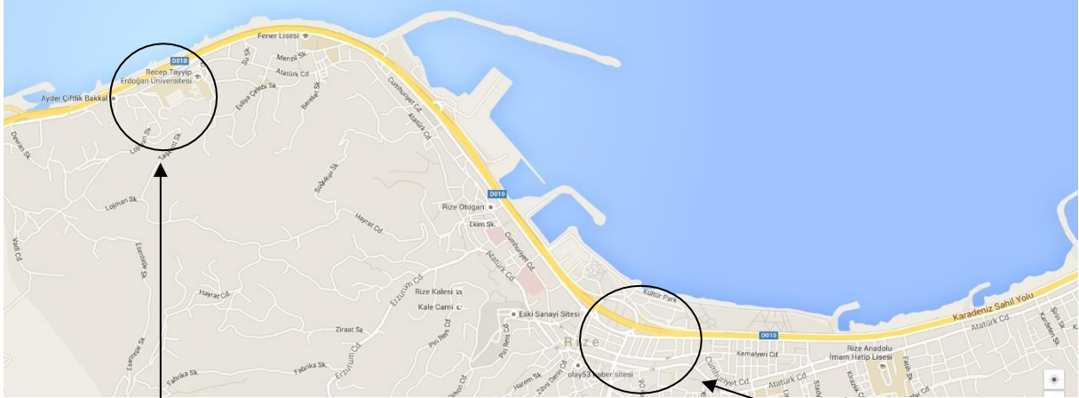
Harita 1: RTEÜ Zihni Derin Yerleşkesi